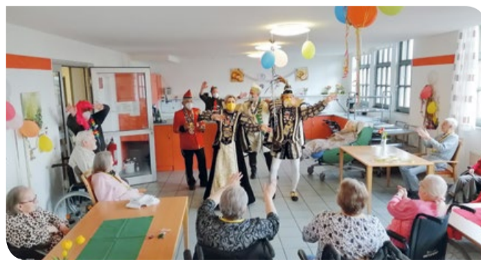
Das Prinzenpaar rockt den Wohnbereich 4