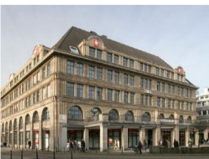
Altenheim im Hansa-Haus, Zentrum

Leben in der Geborgenheit eines modern ausgestatteten Heimes bedeutet, wieder an der Gemeinschaft teilzunehmen, kulturelle Angebote zu nutzen und dabei die Gewissheit zu haben, optimal versorgt und kompetent gepflegt zu werden.