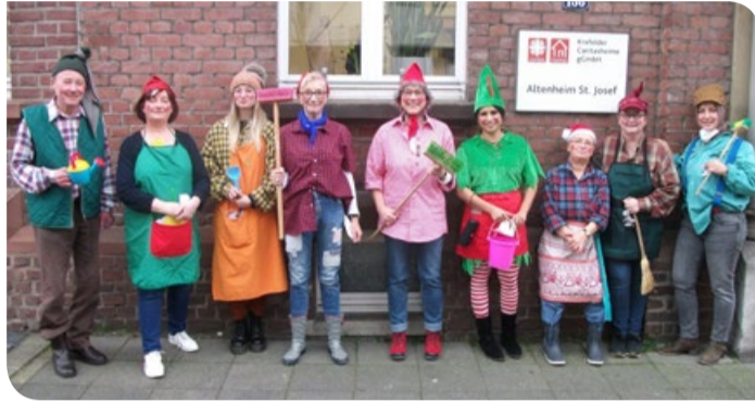
Die Heinzelmännchen von St. Josef