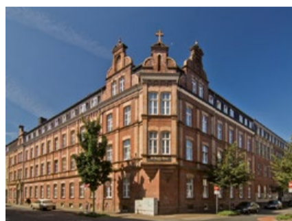
Altenheim St. Josef, Zentrum