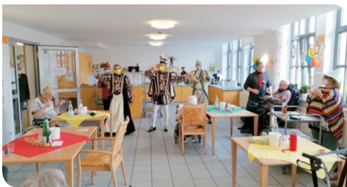
Auch in die Wohnbereiche zog das Prinzenpaar