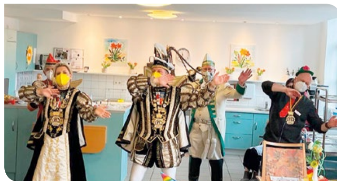
Das Prinzenpaar sorgt für Stimmung im Saal