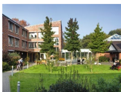
Landhaus Maria Schutz, Traar