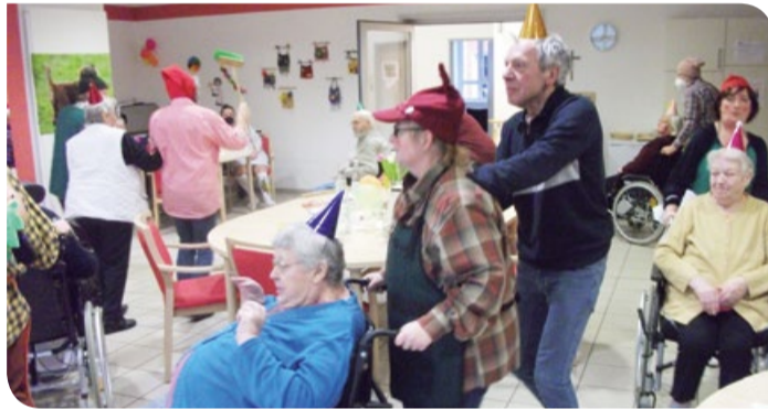
Polonäse durch Wohnbereich E