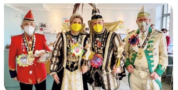
Gut beschützt war das Krefelder Prinzenpaar