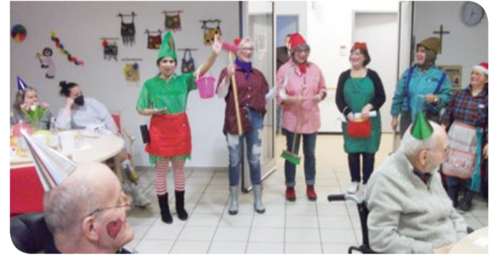
Ein dreifach Helau für die Heinzelmännchen