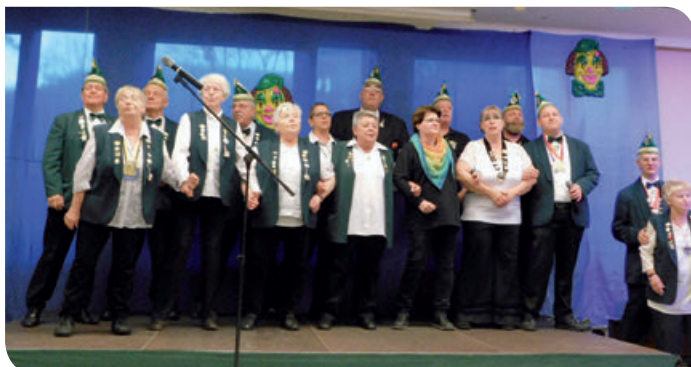
Das traditionelle Abschiedslied