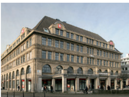
Altenheim im Hansa-Haus, Zentrum

Leben in der Geborgenheit eines modern ausgestatteten Heimes bedeutet, wieder an der Gemeinschaft teilzunehmen, kulturelle Angebote zu nutzen und dabei die Gewissheit zu haben, optimal versorgt und kompetent gepflegt zu werden.