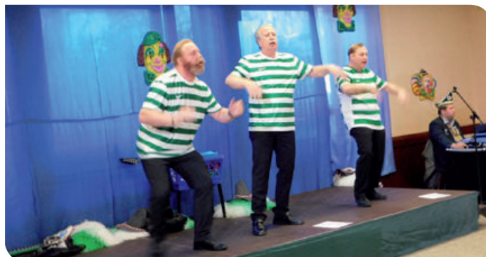
Manpower – die Grönland Boys