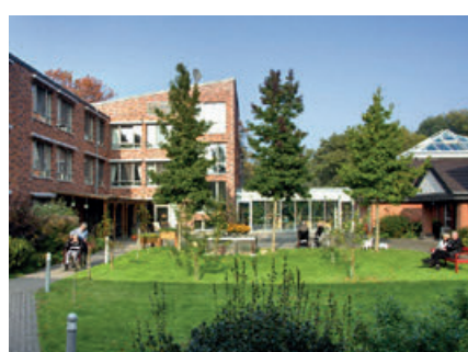
Landhaus Maria Schutz, Traar