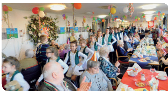
Einzug der Grönländer