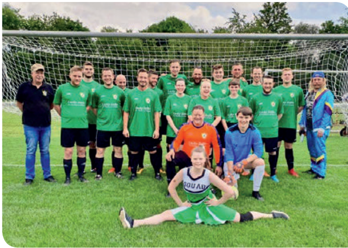
Mannschaft der Grönländer