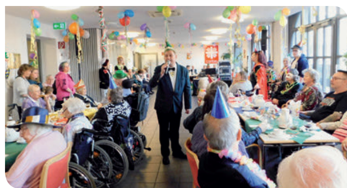
Eröffnung durch Präsident Sven Wiese