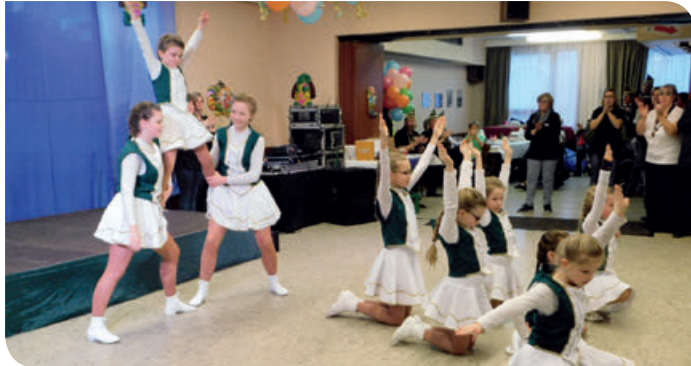
Eindrucksvolles Schlussbild der Tanzgarde